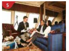
5 The Palace Indulge in European-style butler service and exclusive facilities.