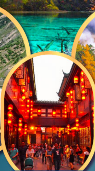
ถนนโบราณจีนหลี่