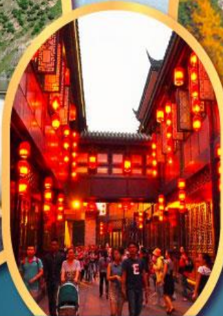
ถนนโบราณจีนหลี่