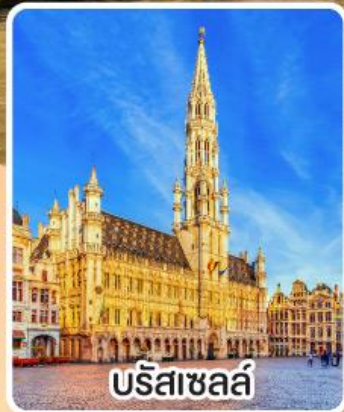
บรีซาเซล