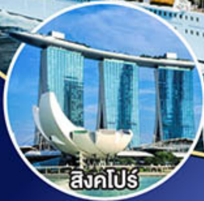
สิงคโปร์