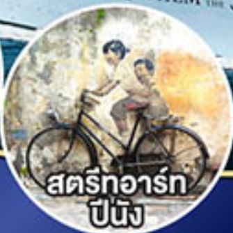
สตรีทอาร์ต ปีนัง