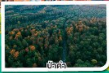
ปีจัตต้า

เดินทาง 20-26 ต.ค. 67 07-13 พ.ย. 67 05-11 ธ.ค. 67