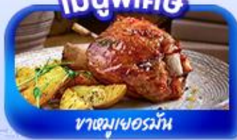
ขาหมูเยอรมัน