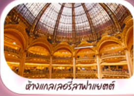
ห้างแลคซัวร์ลาฟาแยตต์