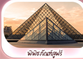
พิพิธภัณฑ์ลูฟร์