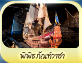
พิพิธภัณฑ์ทิวาซ่า