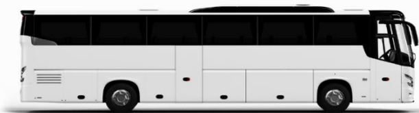
ตัวอย่างรูปภาพรถ 1 ชั้น

ค่าที่พักตามที่ระบุในรายการหรือเทียบเท่าระดับเดียวกัน (พักห้องละ 2 ท่าน) หากประเภทห้องที่ท่านริเคอสมาดำเนินการ เช่น ริเคอสองห้องพักเป็น TWIN BED หรือ DOUBLE BED ทางบริษัทขอสงวนสิทธิ์ในการปรับประเภทห้องพัก เป็นตามที่โรงแรมมีอยู่ โดยไม่ต้องแจ้งให้ทราบล่วงหน้า