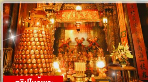
ทริบไหว้พระ