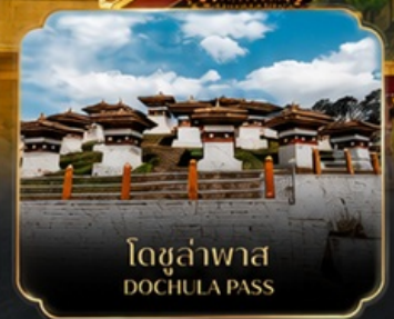
โดชูล่าพาส DOCHULA PASS