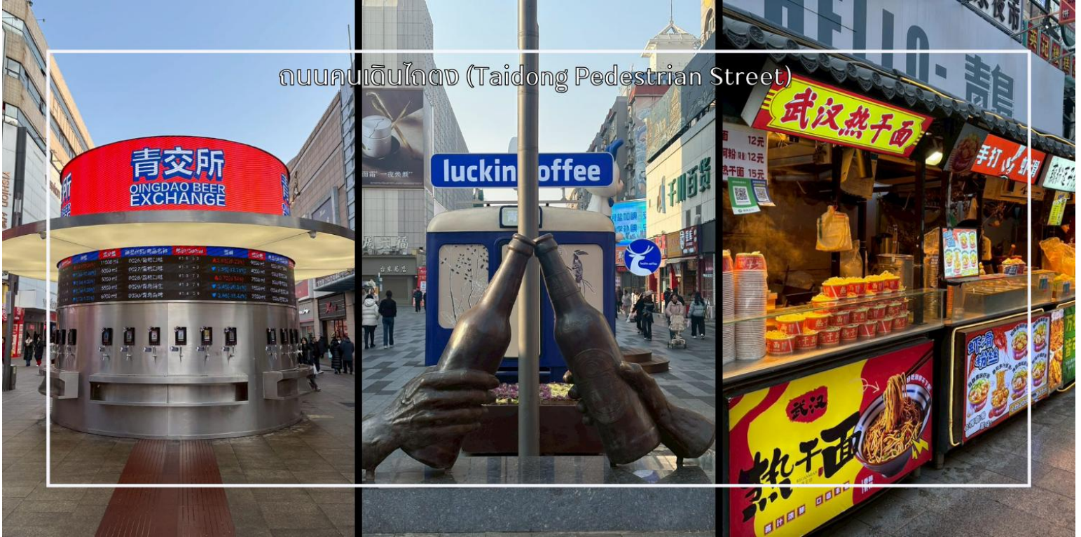
ถนนคนเดินไถตง (Taidong Pedestrian Street)

ถนนคนเดินไถตง (Taidong Pedestrian Street) ย่านการค้าขนาดใหญ่ใจกลางเมือง ชิงเต่า (Qingdao) ที่คึกคักและเต็มไปด้วยสีสันแห่งชีวิตประจำวัน ถนนแห่งนี้เป็นแหล่งรวมสินค้าแฟชั่น แบรินด์ท้องถิ่น ร้านอาหาร คาเฟ่ และร้านของฝากมากมาย เหมาะสำหรับนักท่องเที่ยวที่ต้องการสัมผัสวิถีเมืองและเลือกซื้อของที่ระลึกกลับบ้าน