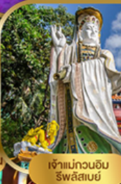
เจ้าแม่กวนอิม ริฟลิสสมัย