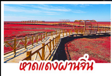
เจาดแคงฝานฉิน