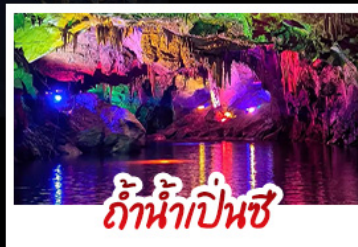
ถ้ำน้ำเป็นชี