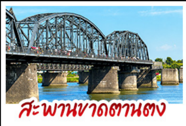
สะพานฆาดถานตาง

2 มหัศจอรร์รรมชาตึระคัฒโลก "หาคแคงฝานฉิน" คู่กับ "ถ้ำน้ำเป็นชี" ยัฒมอญฝัฒเกาหลัเหอื่อที่ตามคง • ชมความยัฒหญ่หญ่ของพระรราชวงษ์สัฒหญ่หญ่หญ่