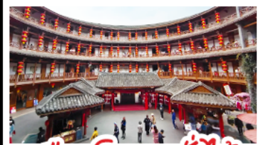
เมืองโบราณลั่วไต้