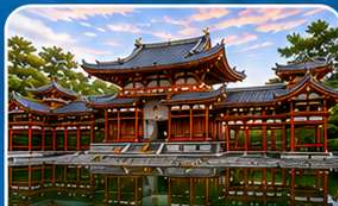
วัดเบียวโดอิน