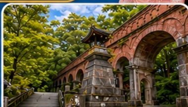
วัดนินเซ็นจิ