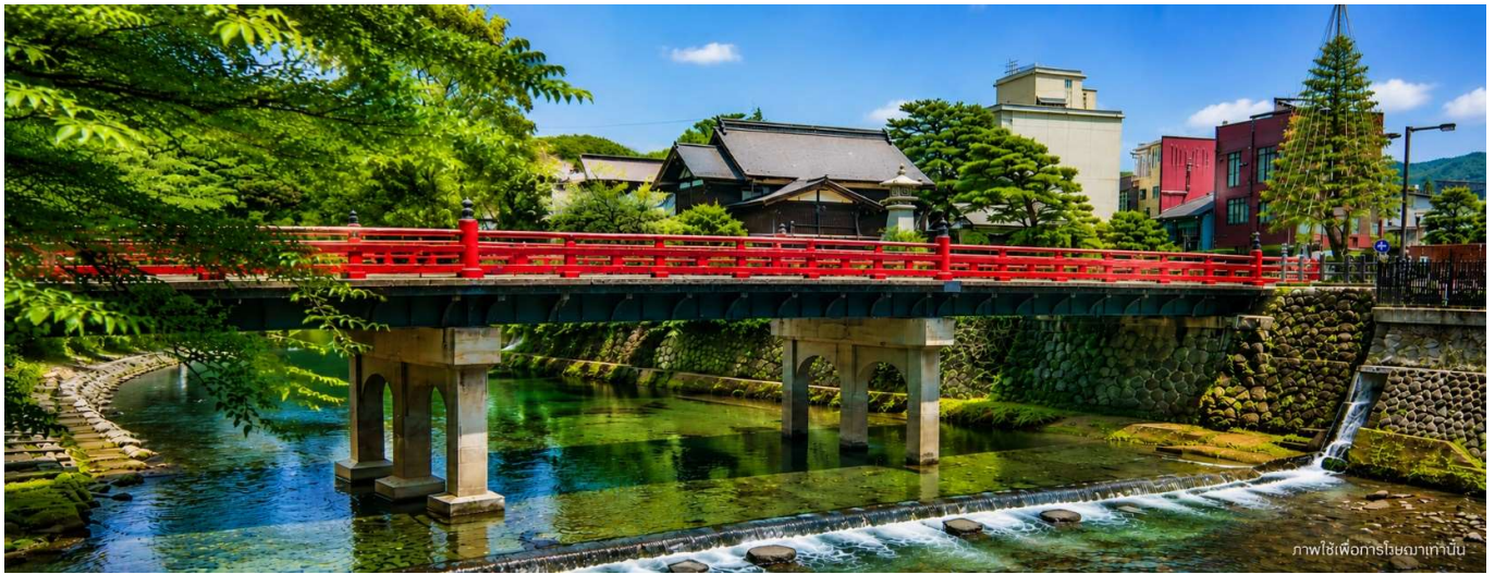
ภาพใช้เพื่อการโฆษณาเท่านั้น

เดินทางสู่เมือง นาโกย่า เมืองใหญ่ใจกลางภูมิภาคชูบุของญี่ปุ่น ผสมผสานเสน่ห์แห่งประวัติศาสตร์ วัฒนธรรม และความทันสมัยได้อย่างลงตัว อีกทั้งยังเป็นศูนย์กลางการเดินทางสำคัญ เชื่อมต่อสู่ทาคายาม่า ชิราคาวาโกะ และคามิโคจิได้อย่างสะดวกสบาย