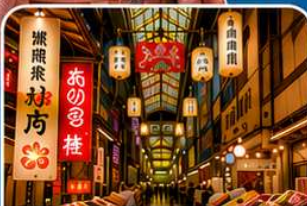
ตลาดปลานิชิกิ