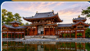
วัดเบียวโดอิน