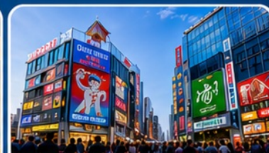
ช้อปปิ้งย่านชินไซบาชิ