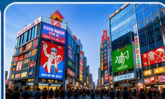
ช้อปปิ้งย่านชินไซบาชิ