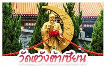
วัดเข่งต้าเซียน