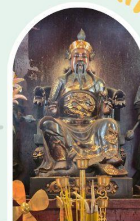
วัดปักไต