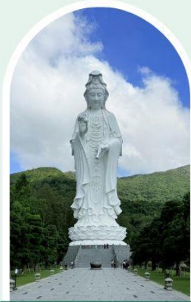
วัดเจ้าแม่กวนอิมชัชอัน

"ไหว้พระ เสริมดวง เพิ่มสิริมงคลแก่ชีวิต"