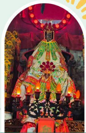
วัดเจ้าแม่กวนอิมฮ่องอ่ำ