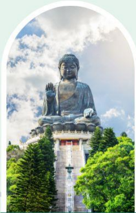
พระใหญ่โป่หลิน