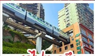
รถไฟทะลุคัง