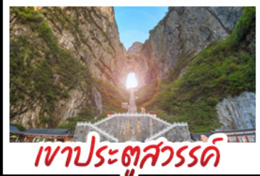
เขาประตูลั่วจื่อ