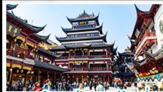
ตลาดร้อยปีเฉิงหวงเหมย