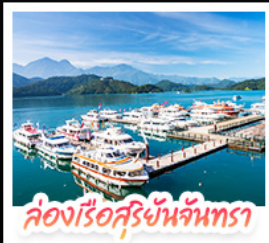
ล่องเรือสุริยันจันทรา

ล่องเรือชมทะเลสาบสุริยันจันทรา (SUN MOON LAKE) ชมเกาะลาลู แคว-วัดสวนทอง • อิสระเดินเล่น หมู่บ้านอิต้าซ่า • นั่งรถไฟเล็กโบราณ (1 สถานี) สัมผัสบรรยากาศเส้นทางรถไฟสายธรรมชาติ • ตะลุย ไทจงโมก้ามาร์เก็ต แหล่งรวมแฟชั่นและสตรีทฟู้ด • ช้อปปิ้งย่าน ซิเหมินตง (XIMENDING) ถ่ายรูปแลนด์มาร์ค ตึกไทเป 101 • ช้อปปิ้งกังทงที่ MITSUI OUTLET PARK ชมความสวยงามของ อนุสรณ์สถานเจียงไคเช็ค • ขอพรความรักที่ วัดหลงซาน ชมโศกหินเสียดรณีที่นี่! เย่หลิว • ชมบรรยากาศเมืองเก่าที่ จิวเฟิน