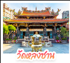
วัดเลกงชาน