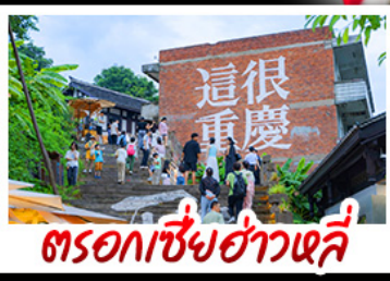
ตรอกซี้ซ่าวหลี่