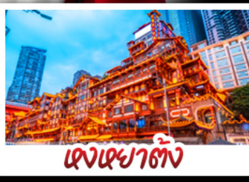
แดนเฉิงชิ่ง