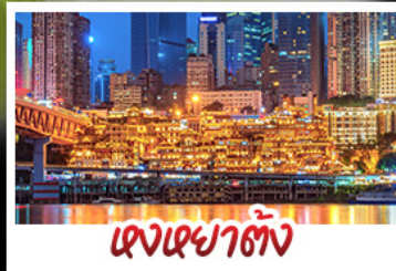
เจดีย์ต้าเจี๋ย