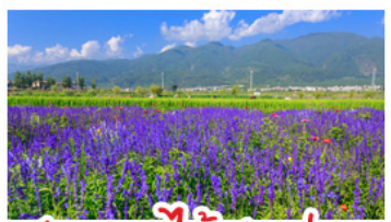
สวนดอกไม้ฮวงวี่มู่ฉ่าง