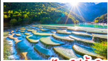
ภูเขาพระจันทร์สีน้ำเงิน

ภูเขาหิมะมังกรหยก - เมืองโบราณเซกรีล่า วัดลามะชงจันหลิน - รถไฟชมวิวภูเขาหิมะมังกรหยก สวนดอกไม้ฮวงวี่มู่ฉ่าง - เมืองโบราณลี่เจียง ภูเขาพระจันทร์สีน้ำเงิน - เบนูพิเศษ สุกีปลาแชลมอน