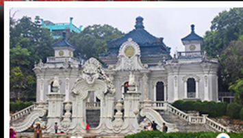
พระราชวังเซวานหมิงเซวานีแฉม