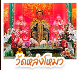
วัดเล่งโง้ว

นั่งรถรางฟ้าดีแถมสู่ TOP OF PEAK • ซ้อมปังจุใจมก และ CITYGATE OUTLAETS • นั่งกระชานองปิง สักการะพระใหญ่เทียนถาน • จอพรเจ้าแม่หล่งโหมว แม่ทอง 5 มังกร ให้ประสบความสำเร็จในทุกๆ ด้าน