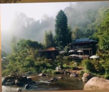
แม่บ้านสวน