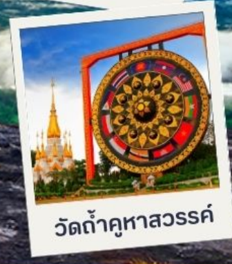
วัดท่าคูหาสวรรค์