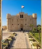
อเล็กซานเดีย