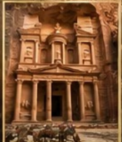
นครเพตรา