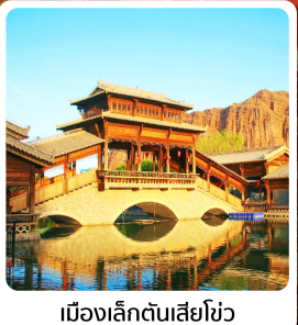
เมืองเล็กตันเสี่ยโซ่ว