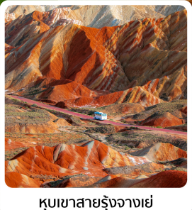
ภูเขาสายรุ้งจากเขี่ย