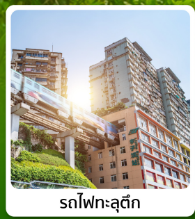
รถไฟทะลุติค

ไฮไลท์! เมืองโบราณกงถาน ล่องเรือแม่น้ำจูเจียง อุกยานถาฮวาหยอน รถไฟทะลุติค หมู่บ้านโบราณฉือชี่โข่ว ถนนคนเดินเจี่ยฟางเปี่ย