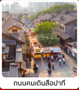
ถนนคนเดินสี่ปาตี