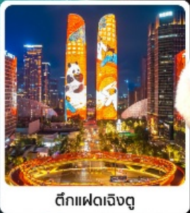
ตึกเฟดเจิงตุ