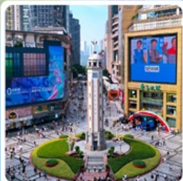
ถนนเจี่ยฟางเป่ย์