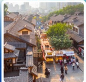
ถนนคนเดินสี่पाที