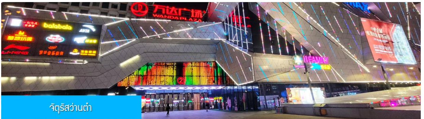
จัตุรัสวานต้า

หลังอาหารนำท่านเดินทางสู่เมือง ฉีฉีฮาร์เอ๋อ 齐齐哈尔市 (ระยะทาง 319 กม. ใช้เวลาเดินทางราว 3 ชั่วโมงครึ่ง)