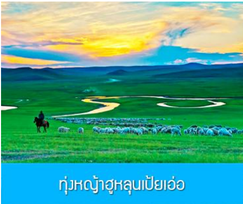
ทุ่งหญ้าฮูลุนเป่ย์เอ๋อ

เช้า รับประทานอาหารเช้า ณ ห้องอาหารของโรงแรม (10)