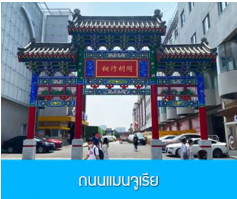
ถนนแมนจูเรีย