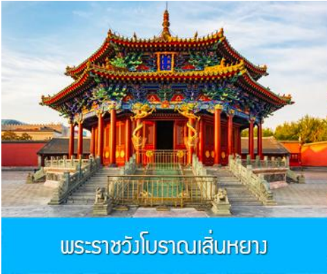
พระราชวังโบราณเสิ่นหยาง

เช้า รับประทานอาหารเช้า ณ ห้องอาหารของโรงแรม (1)