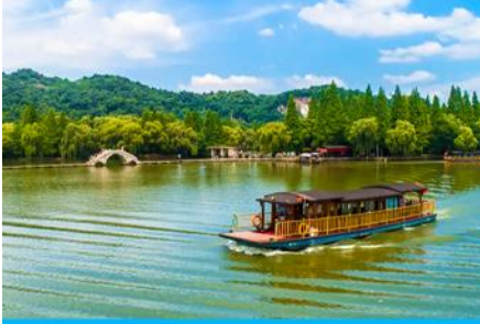
ล่องเรือทะเลสาบเจียนหู