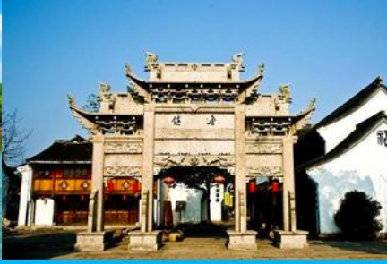
เมืองโบราณ หลู่จี้