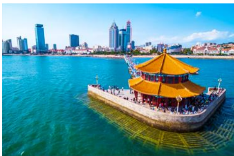
สะพานเคียงเฉียว

เช้า รับประทานอาหารเช้า ณ ห้องอาหารของโรงแรม (1)