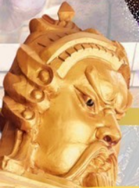
วัดแห่งองค์ปัจจุบัน