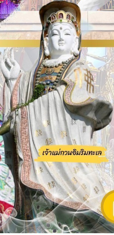
เจ้าแม่กวนอิมวิมทะเล