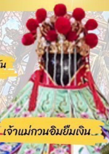
เจ้าแม่กวนอิมยืมเงิน