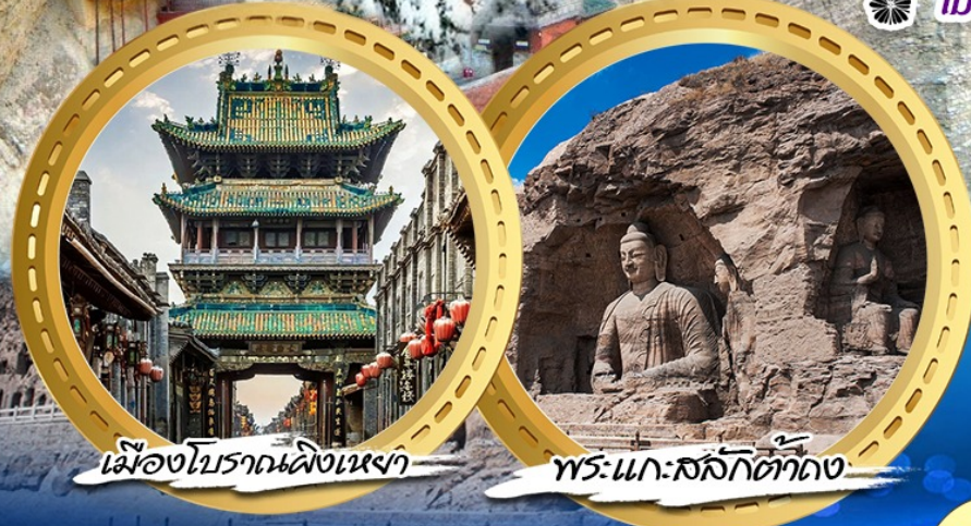
เมืองโบราณผิงเหยา