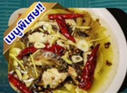
ปลาต้มพริกภาคตอง