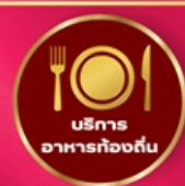
บริการ อาหารท้องถิ่น