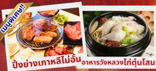
ปิ้งย่างเกาหลีไม่อื่น อาหารวังหลวงไก่ตุ๋นโสม