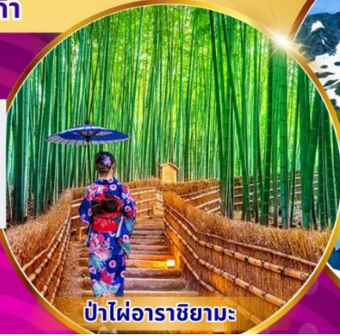
ป่าไฟ้อราชิยามะ

พิเศษ! แอ้อบเซ็น นั่งเคเบิลคาร์ ชมวิวภูเขาแอลป์