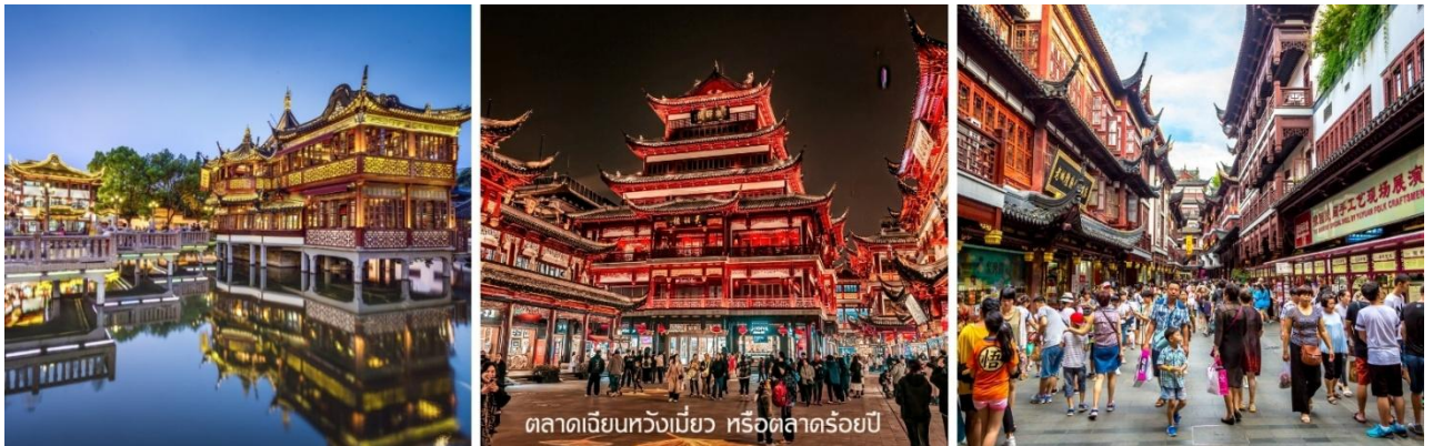
ตลาดเจียนหวังเมี่ยว หรือตลาดร้อยปี

นำท่านสู่ ตลาดเจียนหวังเมี่ยว หรือตลาดร้อยปี เชียงไฮ้ เป็นตลาดเก่าแก่โบราณของผู้ตง มีอาคารบ้านเรือนรูปแบบสถาปัตยกรรมจีนโบราณสวยงามตั้งแต่สมัยราชวงศ์หมิงและชิง และตลาดแห่งนี้ยังมีของที่ระลึกอยู่เยอะแยะบริเวณรอบๆมีร้านค้า ร้านขนม ร้านอาหารขึ้นชื่อของที่นี่ คือ “เสี่ยวหลงเปา” และยังมีแหล่งช้อปปิ้งอันเก่าแก่ยอดนิยมของชาวต่างชาติ