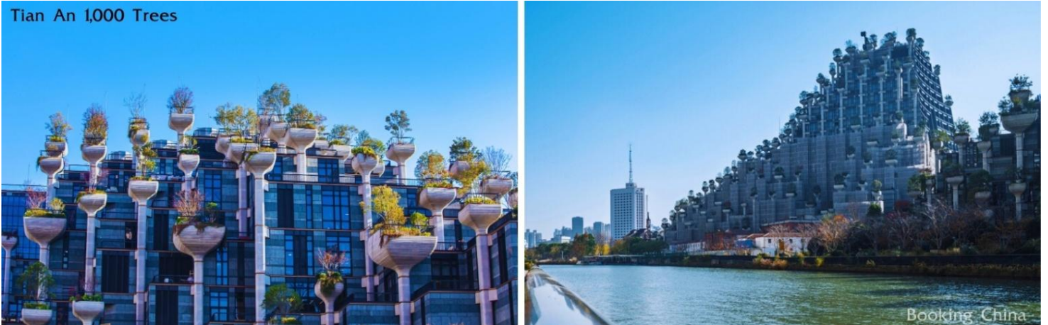
Tian An 1,000 Trees

นำท่านสู่ ตลาดเจียนหวังเมี่ยว หรือตลาดร้อยปี เชียงไฮ้ เป็นตลาดเก่าแก่โบราณของผู้ตง มีอาคารบ้านเรือนรูปแบบสถาปัตยกรรมจีนโบราณสวยงามตั้งแต่สมัยราชวงศ์หมิงและชิง และตลาดแห่งนี้ยังมีของที่ระลึกอยู่เยอะแยะบริเวณรอบๆมีร้านค้า ร้านขนม ร้านอาหารขึ้นชื่อของที่นี่ คือ “เสี่ยวหลงเปา” และยังมีแหล่งช้อปปิ้งอันเก่าแก่ยอดนิยมของชาวต่างชาติ