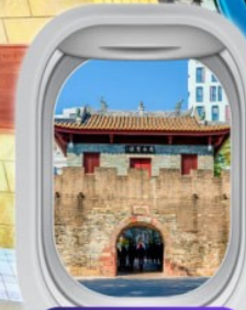
เมืองโบราณหนาวโกว