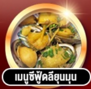
เมนูซีฟู้ดลิ้นจี่