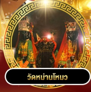
วัดบ้านโหมง