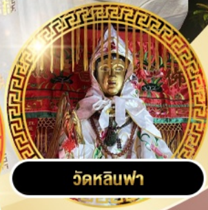
วัดหลิวฟา