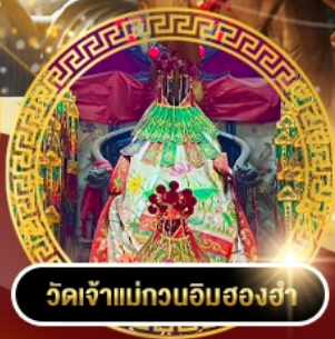
วัดเจ้าแม่กวนอิมสองอำ