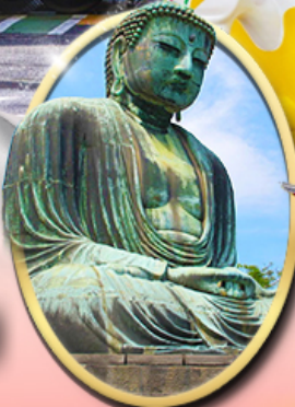
พระใหญ่คามาคุระ