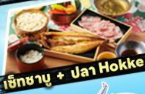
เซ็ทชาบู + ปลา Hokke