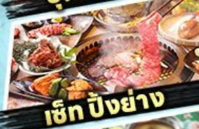
เซ็ท ปิงย่าง