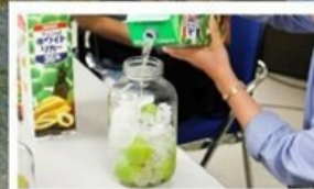
เวิร์ทซ็อปทำ Umeshu