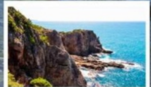
ท้ำซันดินเบท