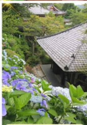
วัดฮาเซเดระ