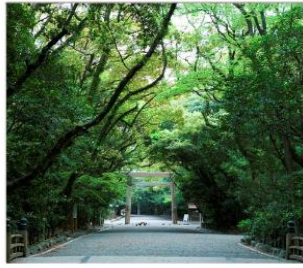
ศาลเจ้าอัสึตะ