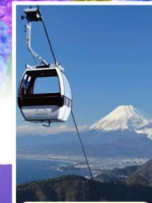
อิซุฟานิรามาวิว

ออนเซ็น 1 คั้น นน.กระเป๋า 23 กก. 7Days 4Night