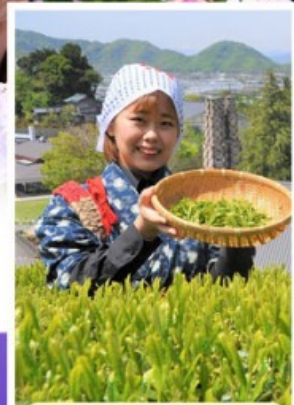
กิจกรรมเก็บชาเขียว