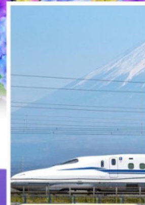
สัมผัสนั่งชินคันเซน